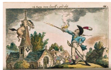
Abb. 3: Kolorierte Radierung von Thomas Rowlandson, 1809.

Übersetzung: Der Stil der Übersetzung nähert sich der heutigen Sprache an, ohne die Herkunft aus dem 18. Jahrhundert ganz zu leugnen. Die Übersetzung geht davon aus, dass neben der kunstvollen, heute aber nicht mehr allen Lesern zugänglichen Fassung des Teil 1 von G. A. Bürger eine moderne Variante Platz und Berechtigung hat.