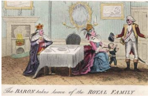
Abb. 4: Kupferstich von unbekannter Hand aus dem Sequel , 1792) «Triumphierend kehrte ich [Münchhausen] zum Schloss zurück, wo die Königin [Marie Antoinette], sanft weinend, in meine Arme fiel. «Oh, Blüte des Adels», rief sie, «wären nur alle Edelleute von Frankreich so wie Ihr, so wäre es nie so weit mit uns gekommen!»» (Nach der vorläufigen Rettung der Königsfamilie; Kapitel xiv)